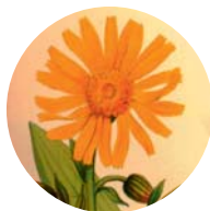
AK für Phytotherapie