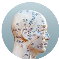
AK für asiatische Medizin – koreanische Handaku- punktur und TCM