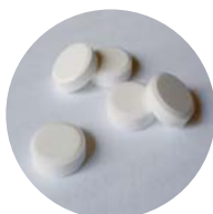
AK für praktische Biochemie