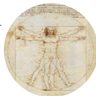
AK Supervision für »Problemfälle« aus der Praxis

Die Termine 2017 entnehmen Sie bitte den folgenden Seiten.