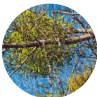
AK für biologische Krebstherapie

Vertiefende Facharbeit wird in unserem Verband großgeschrieben und durch Arbeitskreise gefördert. Angeboten werden sie von Kolleginnen und Kollegen, die ihre besonderen Erfahrungen und Fertigkeiten in bestimmten Verfahren in kleinem Kreis weitergeben. Hierbei kann das eigene Wissen erweitert und therapeutische Fähigkeiten intensiv geschult werden. Unsere Arbeitskreise leisten zudem einen wichtigen Beitrag zur Weiterentwicklung therapeutischer Methoden. Die Teilnahme ist kostenlos, jedoch nur Mitgliedern des Heilpraktikerverbandes Bayern vorbehalten.